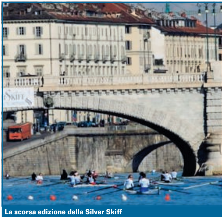
La scorsa edizione della Silver Skiff

→ Più forte di tutto. Nonostante il maltempo ci abbia messo lo zampino, il Trofeo Silver Skiff domenica si svolgerà. La 27ª edizione della regata a cronometro, organizzata dalla Reale Società Canottieri Cerea, è stata però accorciata dai canonici 11 km ai 6,5 per questioni di sicurezza. Per lo stesso motivo il Kinder Skiff di sabato è stato annullato e sarà sostituito da una piccola festa per i bambini, con staffette del remo, al remoergometro, capitanate da campioni del canottaggio, autografi e merenda. Sul fronte Silver, i singolisti al via dalle ore 9,30, a distanza di 15 secondi l'uno dall'altro, saranno 700, provenienti da tutta Europa e da Stati Uniti, Canada, Algeria, Emirati Arabi e Australia. Non mancheranno i super campioni, come i fratelli croati Martin e Valent Sinkovic, che a Torino sono di casa e si dividono le vittorie da qualche anno. Fra gli altri stranieri si segnalano il portoghese Pedro Fraga, quarto