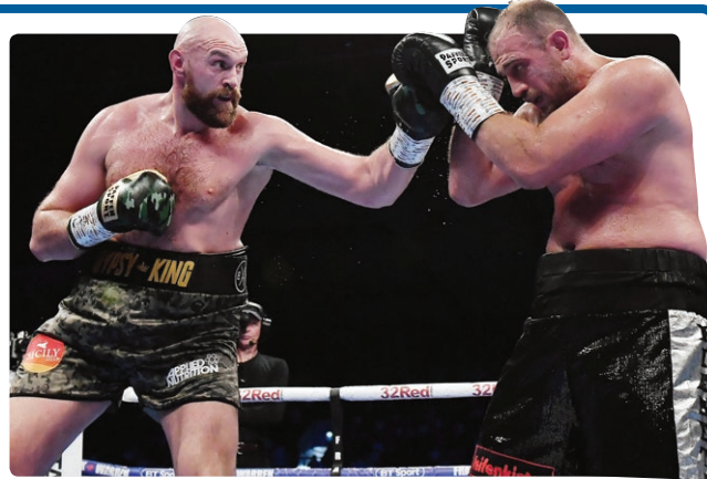
Un momento del match tra Tyson Fury e Francesco Pianeta

(g.m.) Ha lanciato il suo personale guanto di sfida un'istante dopo aver liquidato, come da pronostico, il modesto italo-tedesco Francesco Pianeta. Un incontro, il secondo per Tyson Fury dopo il suo lungo stop, a senso unico, vinto con verdetto unanime. Sbrigate la premiazione, sul palco di Belfast è salito il suo prossimo rivale, l'attuale campione Wbc Deontay Wilder. Il primo faccia a faccia tra i due. «Ti prometto una cosa: quando verrò a Las Vegas, sarò per metterti ko», l'inequivocabile